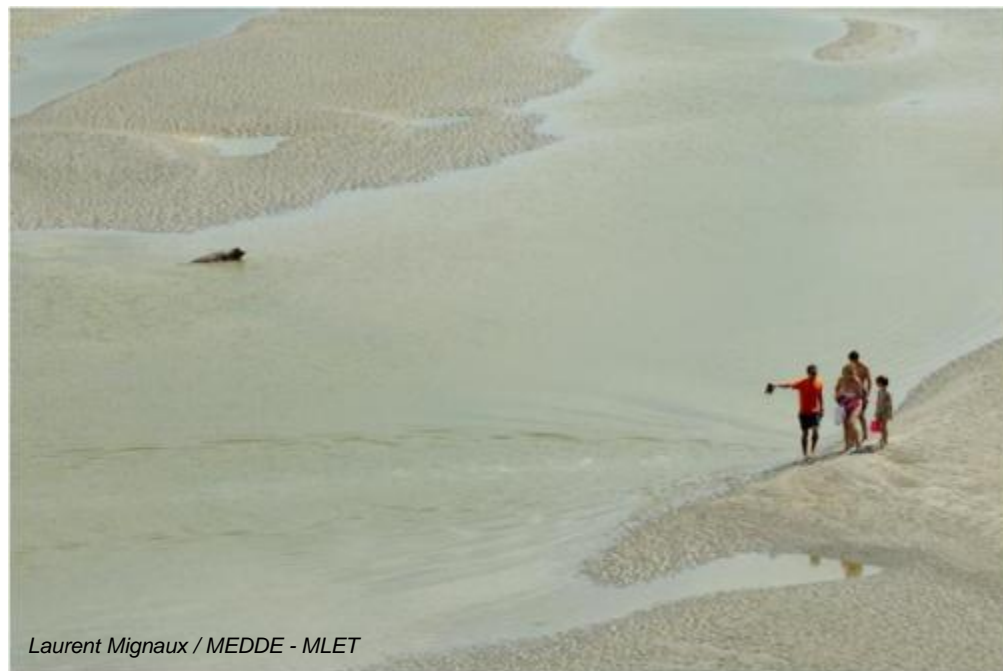
Laurent Mignaux / MEDDE - MLET