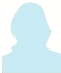
LOEUILLET-BINDIA Magali Assistante administrative

xavier.harlay@aires-marines.fr 03 21 99 15 82 / 06 07 89 58 52